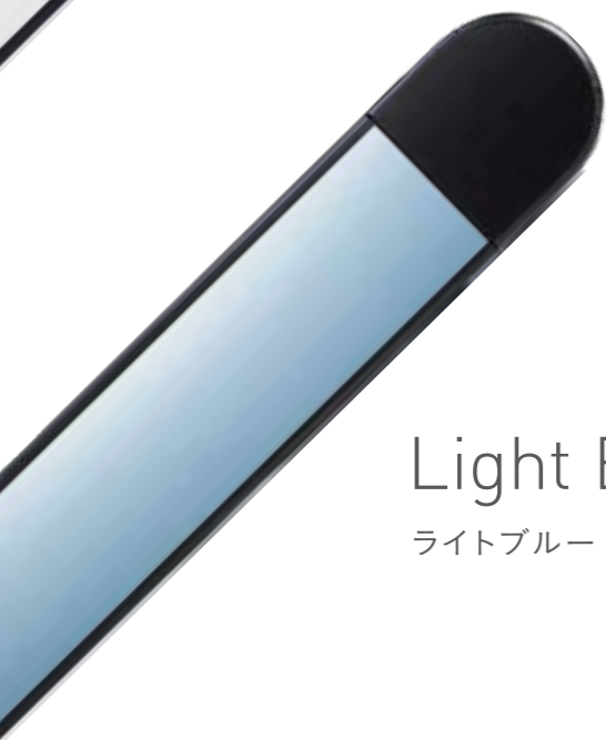
Light Blue ライトブルー