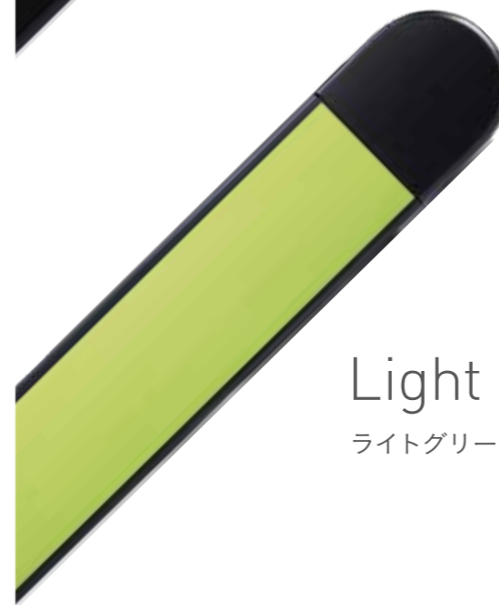
Light Green ライトグリーン